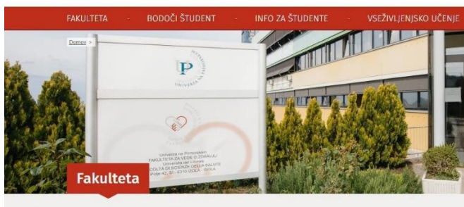
Slika 3: Primer slike